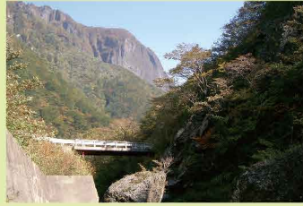
西磐司の景観が冴える風ノ洞橋