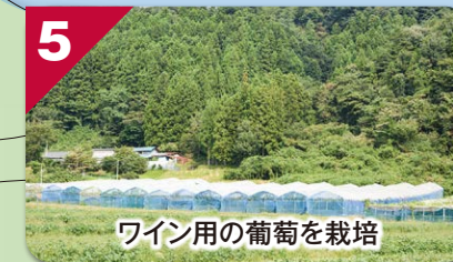
ワイン用の葡萄を栽培