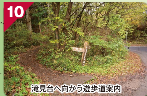
滝見台へ向かう遊歩道案内