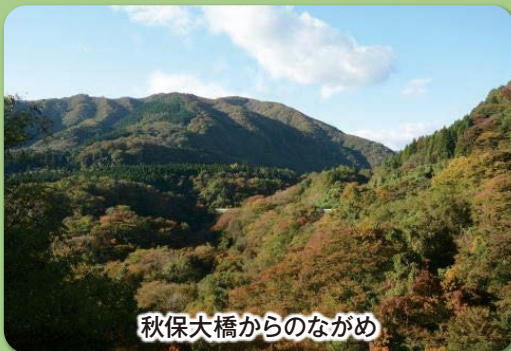
秋保大橋からのながめ