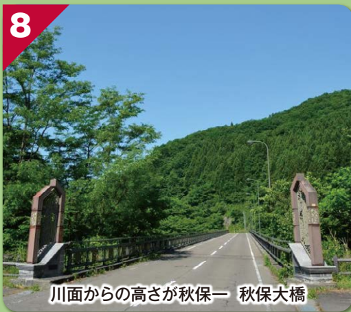
川面からの高さが秋保一 秋保大橋