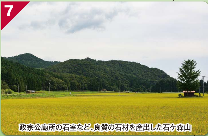
政宗公廟所の石室など、良質の石材を産出した石ヶ森山