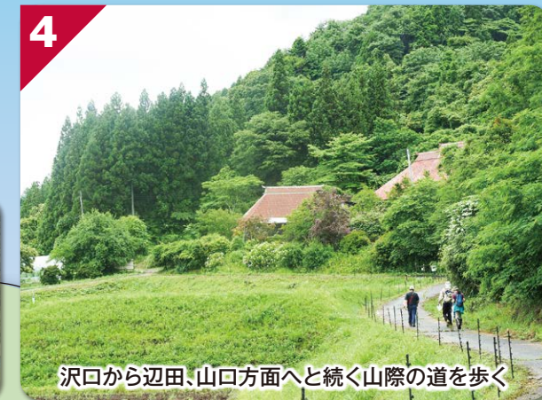
沢口から辺田、山口方面へと続く山際の道を歩く