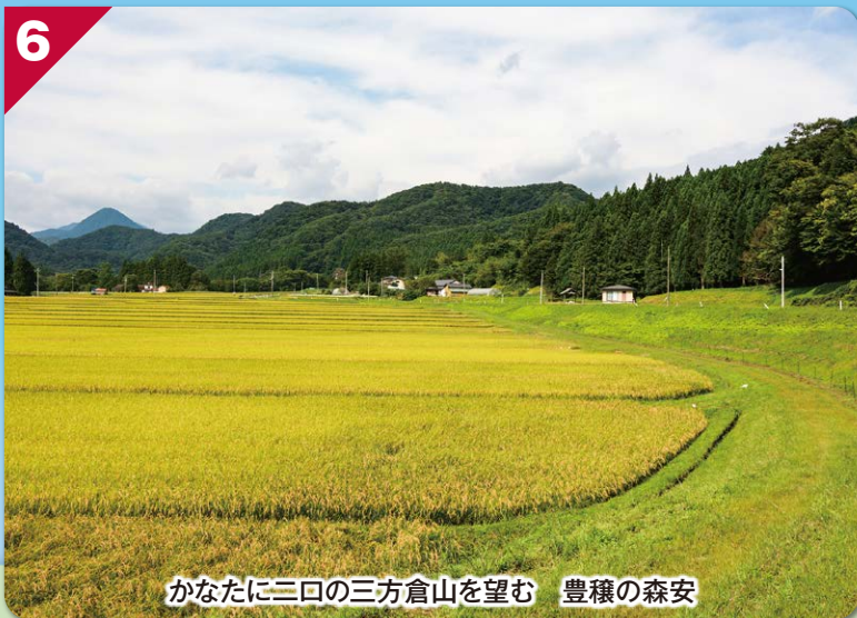
かなたに三口の三方倉山を望む 豊穣の森安