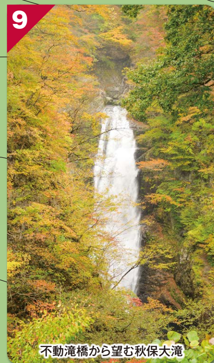
不動滝橋から望む秋保大滝