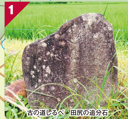
古の道しるべ 田尻の追分石