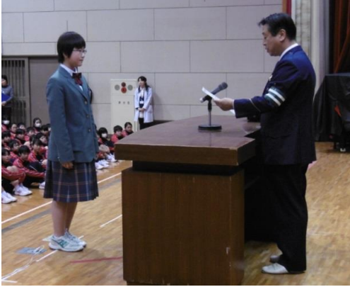
仙台北警察署より指定書が交付されました。

今年も仙台北警察署と宮城総合支所から「自転車マナーアップモデル中学校」に指定され、4月14日(木)に指定書が交付されました。今後も地域のモデルとなるよう、学校全体で自転車のマナーアップに努めていきます。