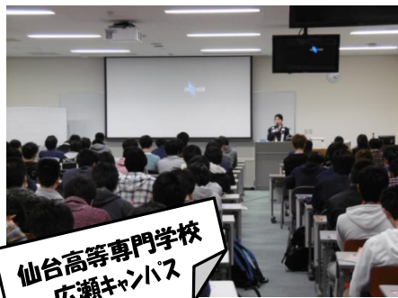
仙台高等専門学校 広瀬キャンパス

赤門自動車学校の協力を得て、全校生徒を対象とする自転車講習会を今年度も開催しました。講習会では、実際に利用している通学路を映像で確認しながら、安全な自転車走行方法などを学びました。