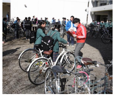
担任教諭と一緒に自転車点検をしました。