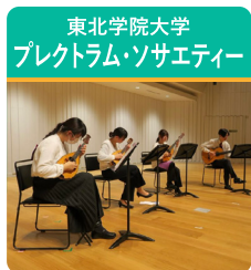
マンドリンの演奏