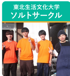
減塩ワークショップ