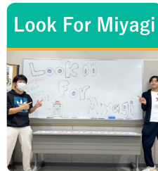
地域イベントの企画など