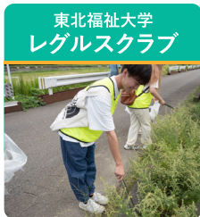
地域清掃活動など