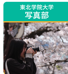
地域活動の撮影など