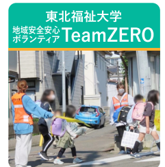
交通安全運動など