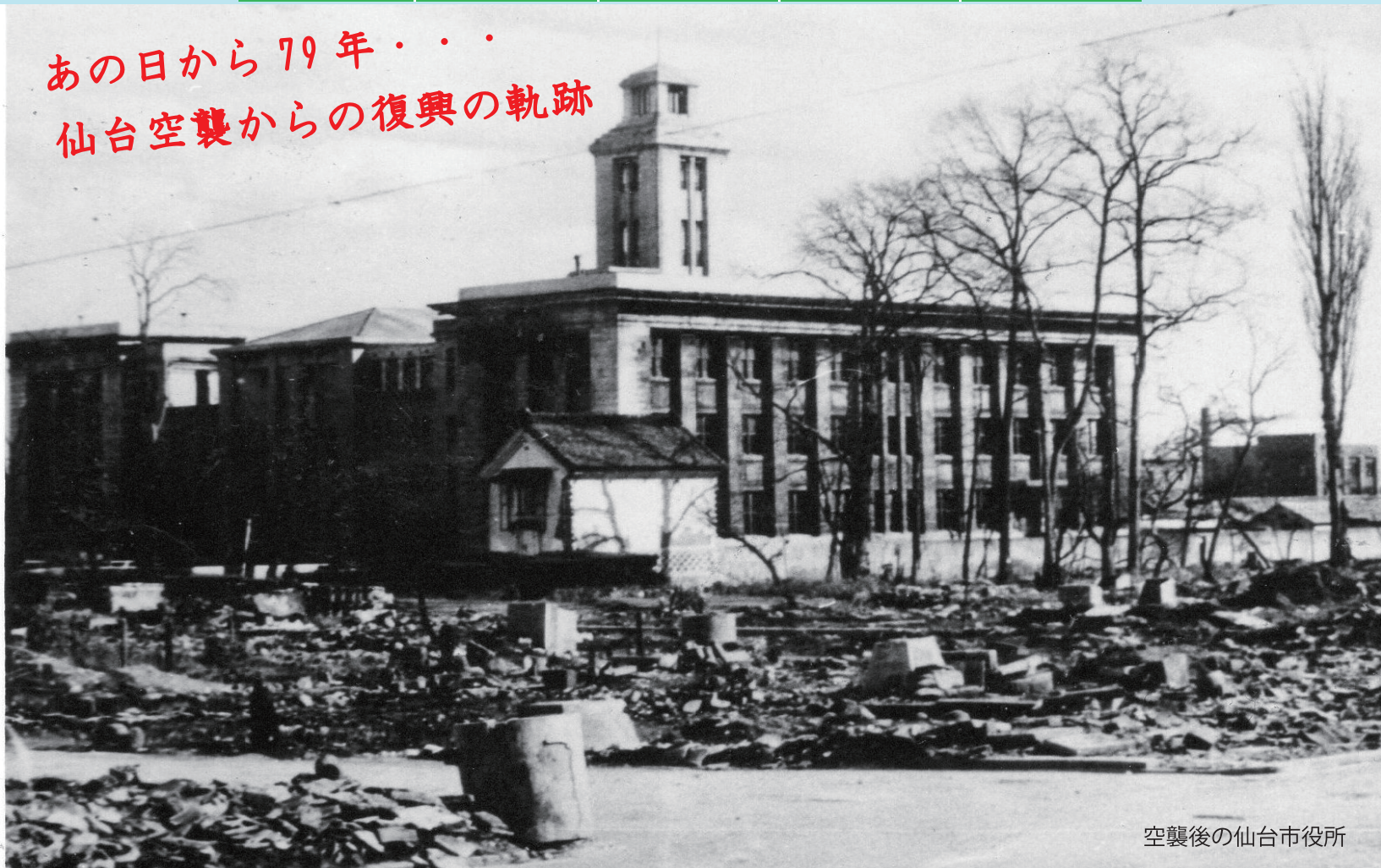
空襲後の仙台市役所