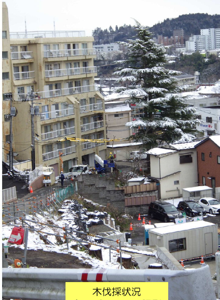
木伐採状況 令和6年2月6日撮影

令和6年1月22日から工事に着手し、工事中は車両通行止めとさせていただきます。これまでガス管の撤去、下水道管の移設・撤去および木の伐採等を行いました。今後は道路擁壁の設置および水道管の移設・撤去工事を行っていく予定です。