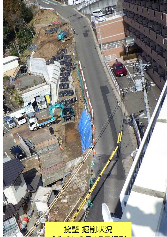
擁壁 掘削状況 令和6年3月15日撮影