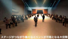
屋外メモリアル広場と連続する屋外広場