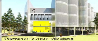
屋外広場から連続し、2層や3層のホワイエ空間へとつながる広場空間