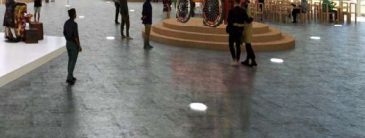
おおらかな円弧状の壁に包まれた大ホール