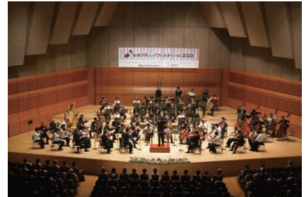
▲仙台クラシックフェスティバル