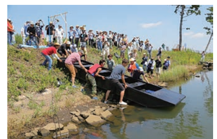
せんだい・アート・ノード・プロジェクト▶