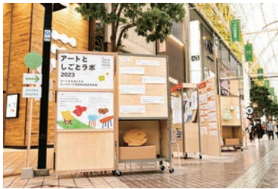
▲助成事業で実施中の取り組み

市民主体により築かれた本市の豊かな文化的環境を未来へとつなぐため、様々な文化芸術活動を多様な主体との協働により推進し、継続、発展に向けた担い手の育成につなげます。また、これからの本市の文化芸術環境を支える仕組みについて検討を進めます。