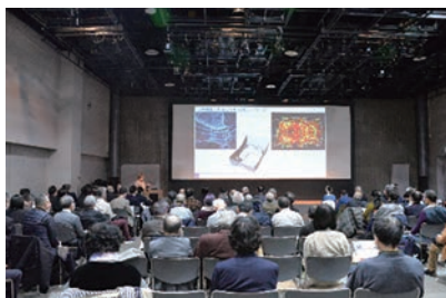
▲シンポジウムの開催

「仙台の文化芸術の総合拠点」となる音楽ホールと「災害文化の創造拠点」となる中心部震災メモリアル拠点の複合整備を進めます。複合施設の強みを生かし、連携・協働事業を実施する等、仙台ならではの創造・発信を行い、仙台と世界をつなげる杜の都の新たなシンボルとなることを目指します。