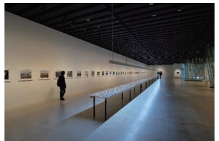
▲自主企画による展覧会