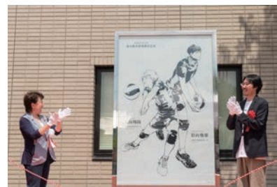
▲ハイキュー!! モニュメントの設置 ©古舘春一/集英社

文化芸術の持つ多様な価値を生かし、仙台はじまりの地とも言える青葉山エリアや仙台の都心等、多くの人が集い、交流が生まれる魅力的な都市空間の実現に資する取り組みを推進します。また、アートプロジェクトの展開を通じて仙台のアートの土壌を豊かにするとともに、仙台ゆかりの多様なコンテンツの活用、新たなコンテンツの創出により、世界への発信力を高め、広くまちの活性化につなげます。