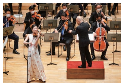
▲仙台国際音楽コンクール