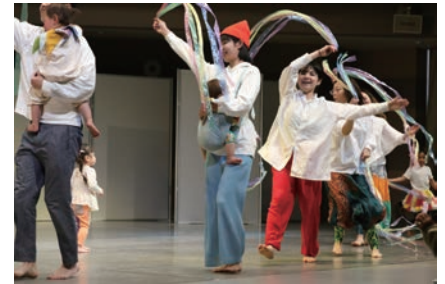
▲文化施設における公演・人材育成・普及啓発事業