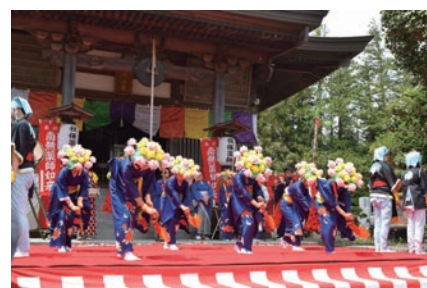
▲秋保の田植踊 (湯元)