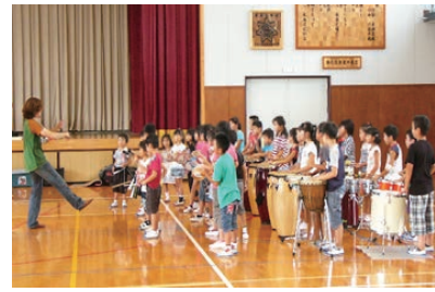
▲アーティスト派遣の取り組み

未来の担い手である子どもたちの豊かな感性を育むため、子どもと共から文化芸術に出会い、親しむ機会の充実を図ります。また、若い世代のアーティストの活動を支援するため、その育成・発表・活躍の機会の創出につながる新たな取り組みについて検討を進めます。