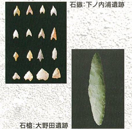
石鏃:下ノ内浦遺跡

槍の先につけられる石器です。縄文時代以前から使われていましたが、縄文時代中期から出土数は少なくなります。石槍はイルカや熊などを獲るために使われていたと考えられます。槍先としての使い方のほかに、短い柄をつけた短剣や片側に柄をつけたナイフとしての使い方も考えられています。