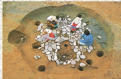
竪穴住居跡：下ノ内遺跡

縄文人は竪穴住居と呼ばれる地面に穴を掘り、地下に床のある住居に住んでいました。屋根と壁がいっしょになって傘のように穴をおおっていたので「縄文人の住まいは竪穴式で、外からは屋根だけのように見える。」というのが、これまでの常識でした。しかし、各地の発掘調査が進むにつれて、そのような住まいだけではなかったことが分かってきました。なかには、床に石をしいた住居や、集会場ではないかと考えられる大きな竪穴住居や、高床式の建物をつくっているムラもあります。