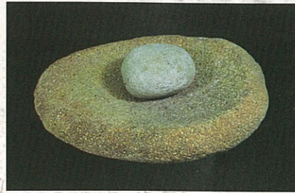
石皿・磨石：大野田遺跡

平らな河原石などの中央を皿状にくぼめた大型の石器で、調理台のような働きをしました。磨石や敲石とセットでドングリ、クルミ、トチなどの実を細かくしたり、山羊などをすりつぶしたりしました。また、ベンガラ（顔料＝朱色の原料となる鉱物）などを粉にするのにも使われたようです。石皿は草創期からありますが、市内では早期後半の遺跡から出土しています。