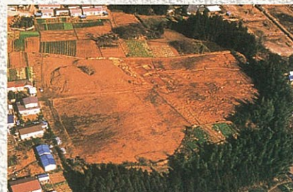
山田上ノ台遺跡 遠景

と考えられます。林の中には主食となるドングリ、クリ、クルミ、などの木の实が豊富で、シカやイノシシ、ウサギなどの獲物も多かったようです。遺跡の南側を流れる名取川ではコイ、フナ、アユ、ウナギなどや、秋にはサケもたくさんとれたのでしょう。縄文人は、安全で快適なだけでなく、食べ物が手に入りやすいかどうかなど、様々なことを考えて住む場所を決めていたようです。