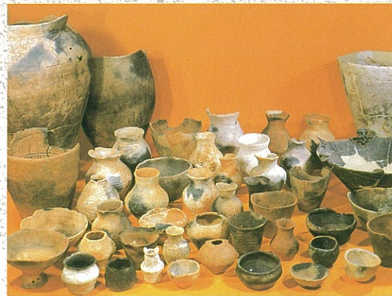
大野田遺跡の土器

細口壺は、中身の出し入れを考えると液体を入れていたと考えられます。キイチゴなどを発酵させて酒を作り、貯蔵したのかもしれませんが。広口壺は、貝輪、石鏃、珠玉などが入った出土例があるので、貴重品入れにも使われていたようです。