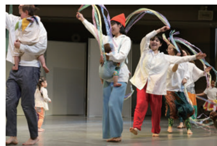
▲文化施設における公演・人材育成・普及啓発事業