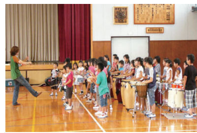
▲アーティスト派遣の取り組み

未来の担い手である子どもたちの豊かな感性を育むため、子どものときから文化芸術に出会い、親しむ機会の充実を図ります。また、若い世代のアーティストの活動を支援するため、その育成・発表・活躍の機会の創出につながる新たな取り組みについて検討を進めます。