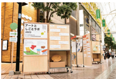
▲助成事業で実施中の取り組み

市民主体により築かれた本市の豊かな文化的環境を未来へとつなぐため、様々な文化芸術活動を多様な主体との協働により推進し、継続、発展に向けた担い手の育成につなげます。また、これからの本市の文化芸術環境を支える仕組みについて検討を進めます。