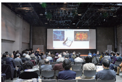
▲シンポジウムの開催

都市に新しい魅力や価値をもたらす杜の都の新たなシンボルとして、「仙台の文化芸術の総合拠点」となる音楽ホールと「災害文化の創造拠点」となる中心部震災メモリアル拠点の複合施設の整備を進めます。整備検討に要する期間を、開館に向けた大切な助走期間と位置づけ、先行事業を実施していきます。