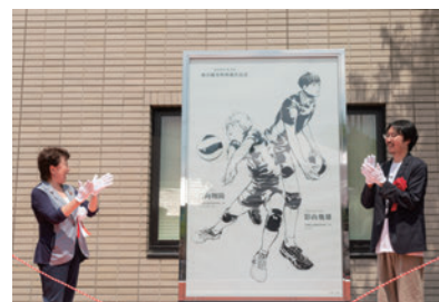
▲ハイキュー!! モニュメントの設置 ©古舘春一／集英社

文化芸術の持つ多様な価値を生かし、仙台はじまりの地とも言える青葉山エリアや定禅寺通をはじめとした仙台の都心等、多くの人が集い、交流が生まれる魅力的な都市空間の実現に資する取り組みを推進します。また、仙台ゆかりの多様なコンテンツを活用した取り組みを推進するとともに新たなコンテンツの創出を図り、世界に発信することを通じてまちの活性化につなげます。