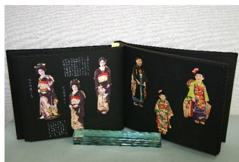
■研究ノート「各国婚礼衣装集 其一」／昭和 12 年 (縦 28.7cm×横 36.4cm)