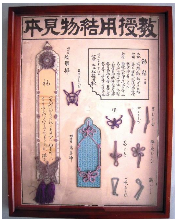
■掛図「教授用結物見本」／明治 23 年 (縦 74.5cm×横 56.2cm 額装)