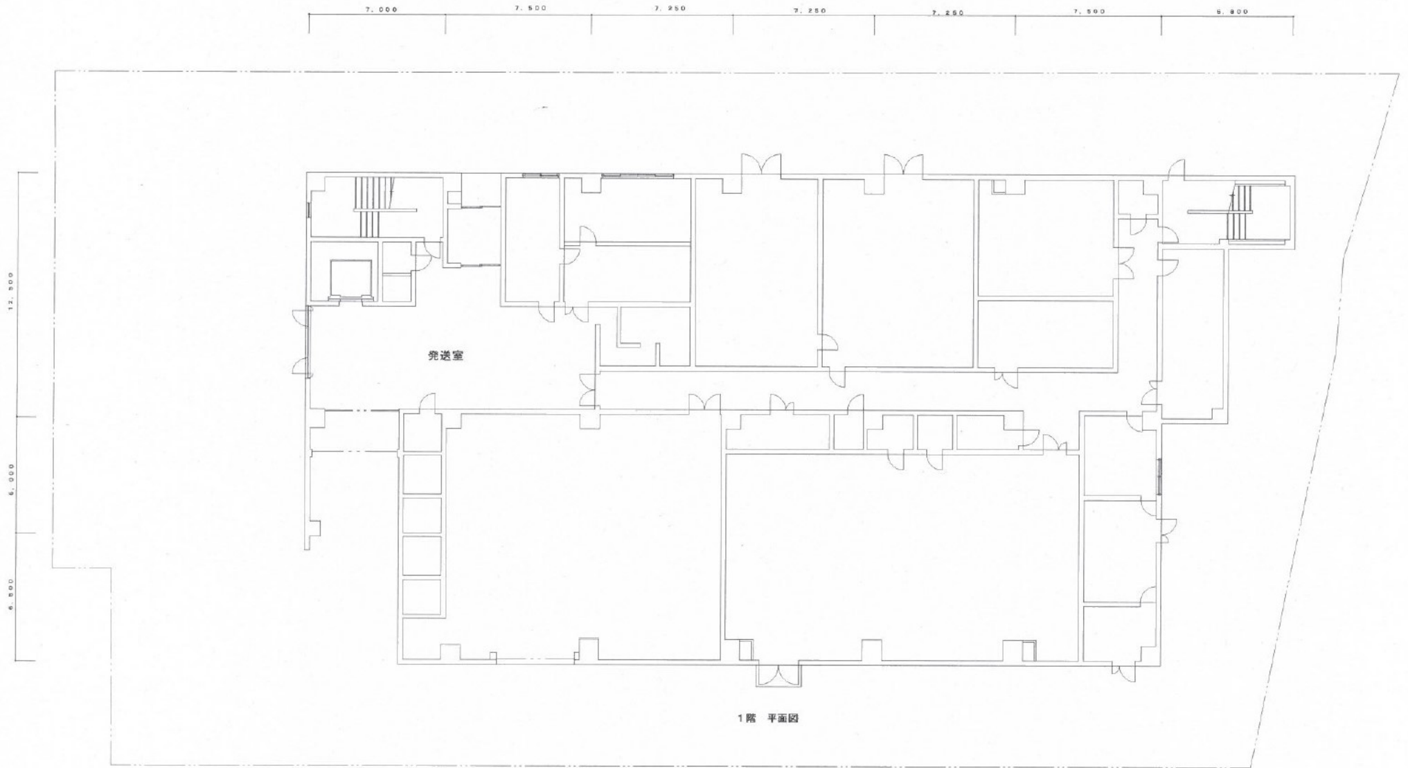
図1 「情報システムセンター1F 建築図」