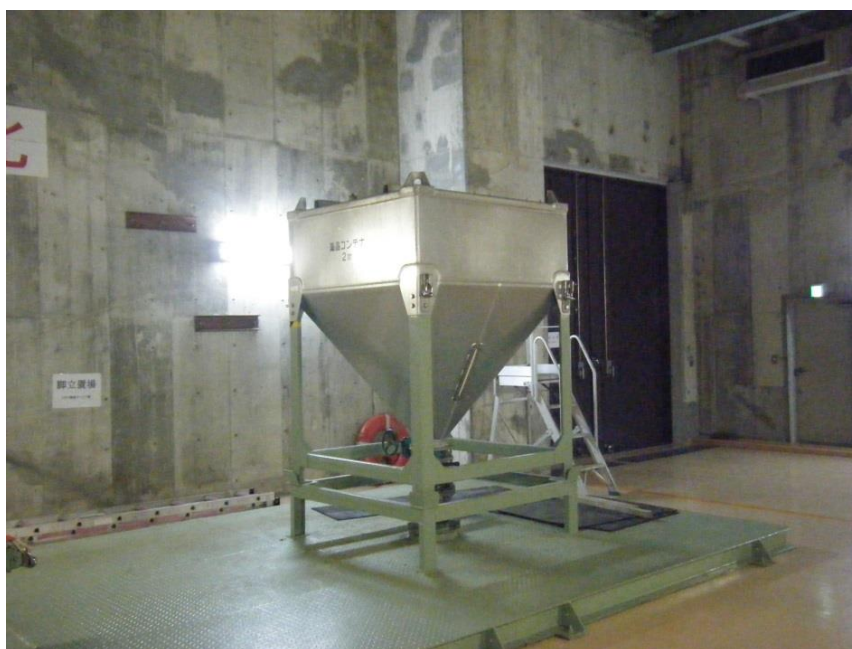
図 1 高分子凝集剤コンテナ外観（設置状態）