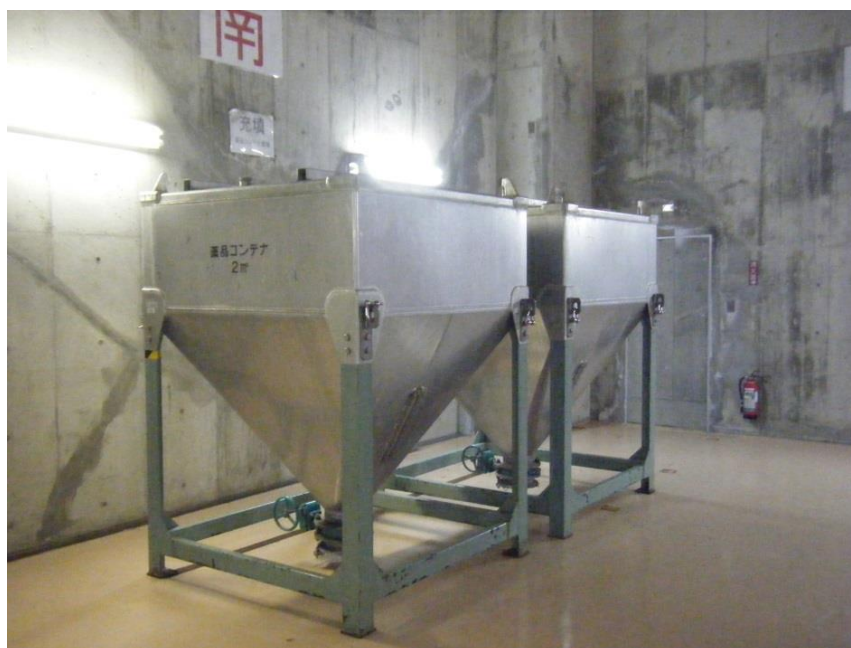
図 2 高分子凝集剤コンテナ外観