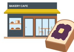
自家製餡を使った ベーカリーカフェ

ウィズ/アフターコロナの消費者行動の変化をいち早く捉え、こだわりの自家製餡をふんだんに用いたベーカリーカフェをオープン予定。