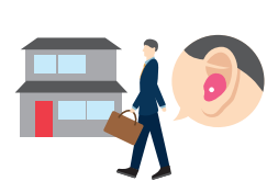
訪問型補聴器専門店