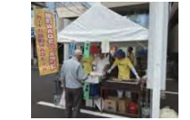
～秋の本通りまつり～ 原町まちづくり委員会 (原町WAGE☆S)