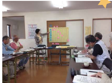
「西中山まちづくり委員会」の準備会

様々な意見を出し合い、課題や魅力などを共有化していくことで、目指していきたいまちの将来のイメージなどが膨らんでいきます。