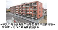
～被災市街地優良建築物等整備事業整備建物～ 河原町・街づくり地権者勉強会