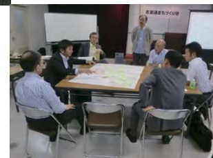
まちづくり勉強会の様子《青葉通まちづくり協議会》