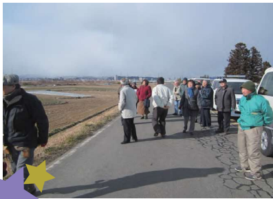
「日辺まちづくり委員会」のまち歩き

地域の身近な方で話題を広め、話し合いや勉強会などを通して、考えてみましょう。 まちづくりを進めるための手法として、まち歩きや先進地視察などがあります。