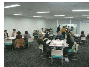
まちづくり勉強会の様子 《原町まちづくり委員会(原町WAGES)》

地域の方が主体的に行うまちづくり活動を支援するため、 仙台市がまちづくりの専門家を派遣することにより、 専門的なアドバイスや情報提供などを行う制度です。