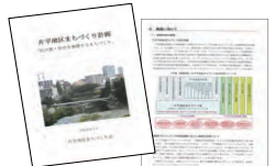
～「杜の都」仙台を象徴するまちづくり冊子～ 片平地区個性ある地球づくり計画策定委員会