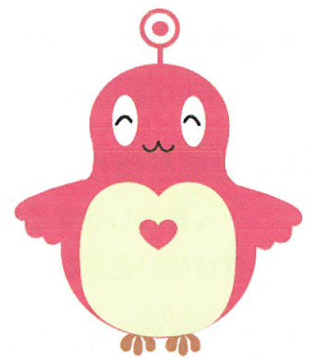
仙台市障害理解促進キャラクター「ココロン」

こうした「生活のしづらさ」を取り除き、誰もが安心して暮らせるまち仙台をめざして、「仙台市障害を理由とする差別をなくし障害のある人もない人も共に暮らしやすいまちをつくる条例」を制定しました。障害を理由とする差別をなくし、誰もが生きがいをもって、共に支え合いながら、安心して生活を送ることができる社会の実現のため、市民の皆様と一緒に取り組んでいきます。