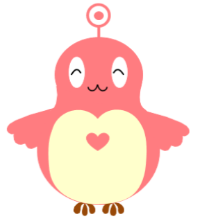
仙台市障害者理解促進キャラクター「ココロン」

地域課題の詳細な把握や解決策の検討・試行、社会資源の掘り起こしと開発、取組内容の効果検証等を集中的に行うにより地域課題の解決を図る