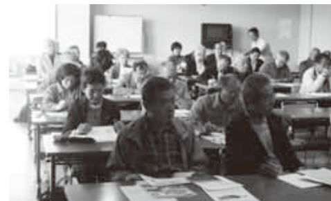
片平地区で実施したマンション防災研修会の様子

は、マンションとのコミュニティづくりを図るための冊子などを活用しながら、管理人かマンション内の住民に福祉委員をお願いする交渉を地道に続けているそうです。