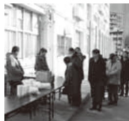
指定避難所での炊き出しの様子

「登録・未登録に関わらず、現実には声をかけてもらいたいと思っている高齢者がいるので、今年3月からは65歳以上の対象者には、なんとかして見守りをしていこうと動き始めました。そうすると250人全員にそ