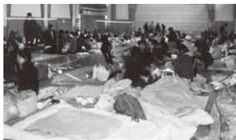
多くの避難者が押し寄せた市民センター

片平地区連合町内会のエリアは、6地区8町内会で構成され、世帯数は約5,300。エリア全体で見るとマンションが多いことが特徴と言えます。さら