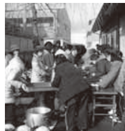
町内会の集会所でも 行われた炊き出し

避難所に集まってからの運営は、事前の取り決めと防災訓練によって、大きな問題もなく進めることができたといいます。「学んだのは公助ばかりに頼るなということです。何がもらえないとか、何が来ていないとか、もらうことだけ考えがちですが、基本は地域で自助・共助を考えないといけない。震災をきっかけに、自分が住む家とその周辺のまちの人たちが、いざというときには一致団