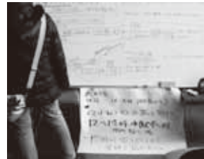
ホワイトボードをロビーに設置し情報を共有

さらに、事前に把握していた70歳以上の世帯への戸別訪問、安否確認と物資の配給までできたといいます。