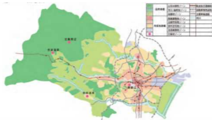
仙台市「杜の都」景観計画 ゾーン概念図

「杜の都」仙台の伝統と個性を誰もが実感できる景観の創生が図られるよう、 仙台市『杜の都』景観計画 に基づいて、ゾーン毎の建築物等の形態・意匠、高さ、色彩、緑化の基準に基づく届出や違反広告物の除却等により、良好な景観形成を図ります。