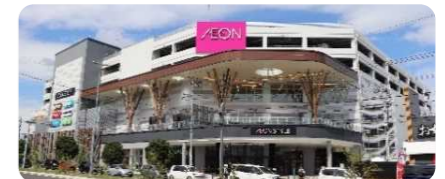
地区計画の変更により建設された商業施設(卸町)

土地所有者や事業者が 都市計画提案制度 や 東西線沿線都市計画提案募集 など各種制度の活用が容易となるよう、周知・支援を行います。