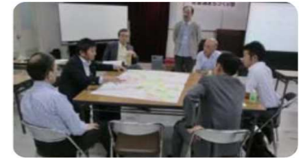
勉強会の様子 仙台市「まちづくり支援専門家派遣制度リーフレット」

居住者や事業者などが主体となったまちづくりの機運醸成に向けて働きかけを行うとともに、地域で取り組むまちづくりについては まちづくり支援専門家派遣制度 の活用などにより支援を行います。