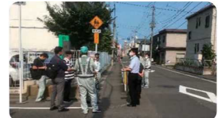
通学路合同点検の様子(仙台市道路事業方針)

子どもたちの登下校中の安全を確保するため、学校関係者、宮城県警察、仙台市が一体となって、 通学路の合同点検 を実施し、交通安全対策を進めます。