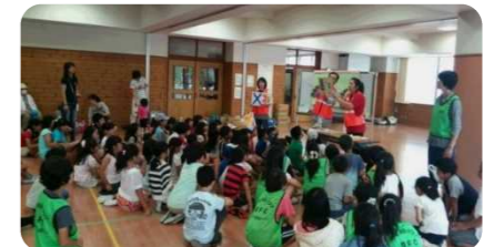
地域コミュニティで相互に助け合う「共助」の取り組み(仙台市地域防災リーダー(SBL))

地域コミュニティで相互に助け合う「共助」の取り組みの推進を図るため、地域防災の担い手となる 仙台市地域防災リーダー(SBL) の養成や活動支援を行います。