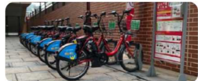
DATE BIKE(せんだい都市交通プラン)

駅周辺における回遊性の向上を図るため、 コミュニティサイクルの拡充 について検討します。