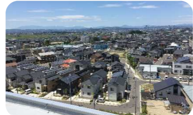
荒井東土地区画整理事業(住宅ゾーン)

駅周辺にふさわしい土地利用や施設立地が図られるよう、土地所有者等への働きかけを行うとともに、 土地区画整理事業 、 市街地再開発事業 や 優良建築物等整備事業 などを支援していきます。