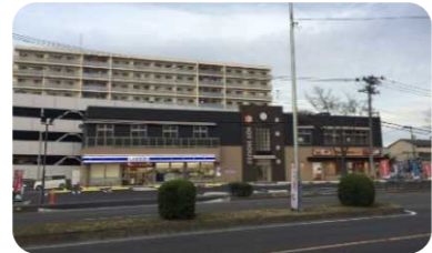
生活サービスの複合施設のイメージ

住まう快適性と安心が実感できるよう、地域特性に応じて、暮らしに必要な生活サービス施設(スーパー、飲食店、医療施設など)を誘導するなど、 土地利用のあり方 について検討します。