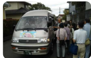
駅や生活利便施設地域を経由する乗り合いタクシー(燕沢地区「のりあいつばめ」)

高齢者をはじめ住民の移動手段が確保されるよう、路線バスの利用促進を図るとともに、公共交通のサービス水準の低い地域においては、地下鉄との乗り継ぎ利便性を高める停留所の設置や生活利便施設(医療施設、スーパーなど)を経由する乗合タクシーの運行等、 地域のニーズに合った地域交通導入 について、検討段階における専門家の派遣や運行維持への支援を行います。