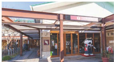
秋保・里センター