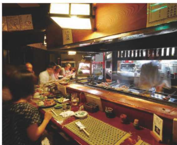
●詳しくは右記二次元コードの「仙台夜時間」からご覧ください。