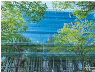
〈せんだいメディアテーク〉