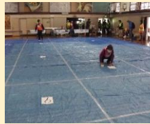
居住スペースの間隔の確保

市名坂小学校区では、新型コロナウイルス感染症の感染が拡大する中で、災害時の避難に役立ててもらおうと、啓発チラシを作成し、地域に配布しました。感染症対策を行った場合の体育館の収容人数等をレイアウトで示すとともに、安全が確認できる場合の避難先として、在宅避難や親戚、知人宅に避難する分散避難を呼びかけました。コロナ禍における地域の取り組み事例としてバックアップ講習会でも紹介しました。