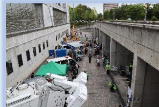
← はたらく車の展示