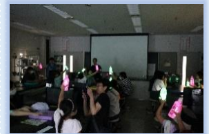
↑ 防災ランタンづくり