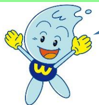
水道局キャラクター ウォーターくん