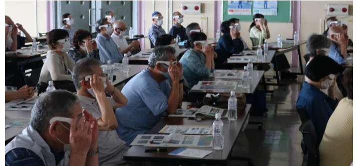
3Dメガネによる立体映像体験

後半は、マイ・タイムラインをテーマにワークショップを行い、「仙台防災ハザードマップ」の活用方法や、今年5月の法令改正に伴い変更された「警戒レベル」について理解を深めていただきました。