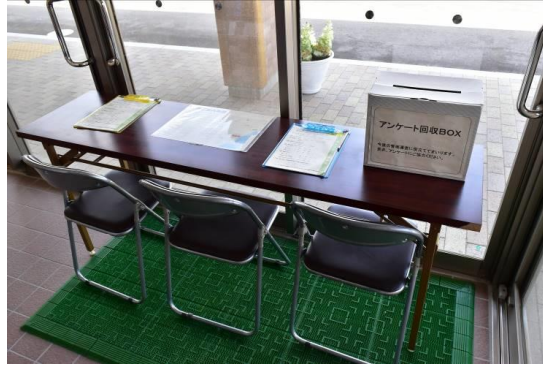
アンケート結果（37枚）

年間を通じてクラブハウス内にアンケート記入スペースを設置し、受付の際等記入を呼びかけている。