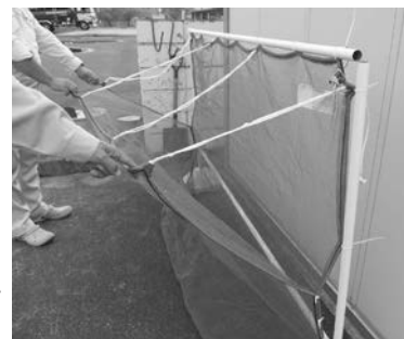
▲ハンサムネットは、集積所の状況に合わせて、形状を工夫しています

ハンサムネットについて詳しくは、お住まいの区の環境事業所にお問い合わせください。