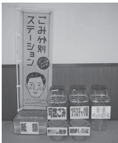
▲エコステーションキット イベントで出るごみの分別に必要な物品がそろっています