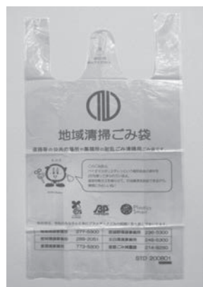
▲地域清掃ごみ袋 サイズは2種類（大と小）あります