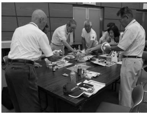
▲ごみ分別体験研修会

推進員活動を行うに当たって有益な知識や手法を身に付けていただくため、さまざまなテーマ・形式で研修会を開催しています。推進員同士の交流や情報交換を図る場にもなりますので、ぜひご参加ください。(適宜、ご案内を郵送いたします)