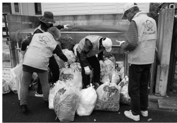
◀調査風景 調査は、袋の外観から目視で行います

自分が住む地域のごみの排出状況を知ることで、問題点を把握し、以後の推進員活動の手掛かりとしていただくことを目的とした調査で、毎年秋に実施をお願いしています。地域の方々にも参加を呼び掛けて一緒にごみの排出状況を確認してもらうことで、出し方マナーの改善につながるほか、推進員やメイトの活動を知ってもらうこともできます。