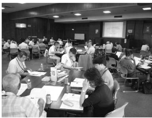
▲ワークショップ形式での研修会