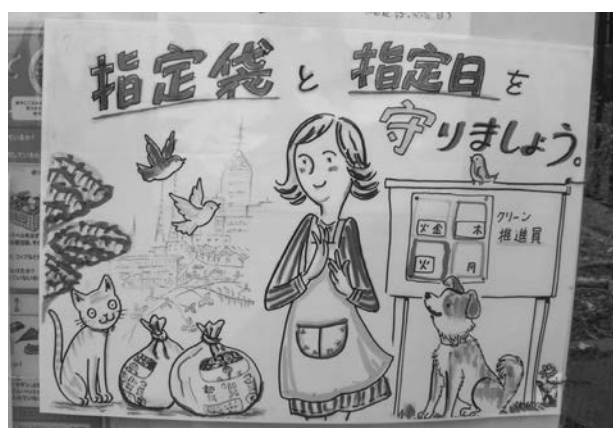
◀集積所掲示用ポスター