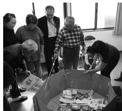
▲出前講座では、ごみの分別をゲーム感覚で楽しく学ぶメニューなども用意しています