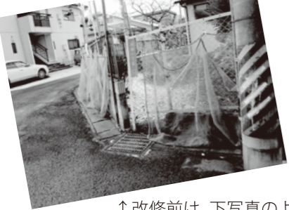
↑改修前は、下写真のように、ハンサムネットが塀の3面にわたり直接かかっていたものを、上写真のように壁の2面に工作物を設置。公道沿いであるため、できるだけ幅を取らないように工夫。