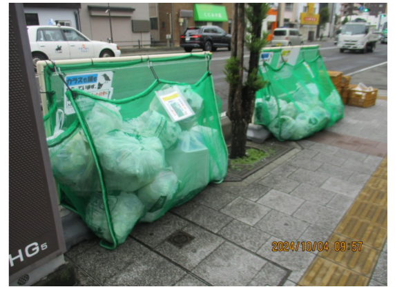
↑ハンサムネット設置後

ハンサムネットは、たくさんの町内会で活用されており、市内の設置数は1,900か所を超えています。設置した地域の方々からは、カラス被害が減ったと好評をいただいています。ハンサムネットを設置する場合は、設置場所や使用する世帯数等、調査が必要になりますので、各区の環境事業所へご相談ください。カラスや猫に対して効果があるハンサムネットですが、使用していくうちに、ネットが破れてしまうことがあります。地域によっては、ネットを補修していただきながら使用していただいております。ハンサムネットは、同じものを3年間ご使用いただくことを基本としておりますが、経年劣化等で損傷が激しい場合は、3年未満でも交換対応ができる場合がありますので、各区の環境事業所へご相談ください。環境事業所では、集積所の改善支援や啓発のお手伝いをしていますので、お悩みの場合は、お気軽にお住まいの区の環境事業所へご相談ください。