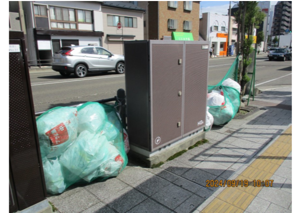
↑ハンサムネット設置前

ごみ集積所のカラス被害対策に使用する「ハンサムネット」をご存じでしょうか。ハンサムネットは、通常の「飛散防止・鳥獣対策用ネット」を袋状に加工したもので、カラスなどがごみ袋をつつくのを防止するものです。