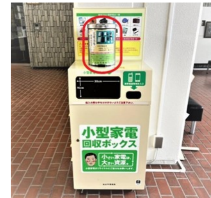
充電電池等回収ボックスの設置例