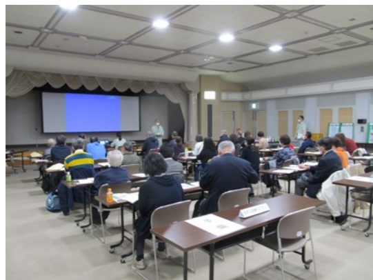
若林区での研修の様子

令和3年11月から12月にかけて各区においてクリーン仙台推進員初心者研修会を行いました(新型コロナウイルス感染症拡大防止のため、太白区の研修は中止)。研修会には、7月に初めて委嘱を受けた初任者の皆さまをはじめ、多数の方々に出席していただきました。 研修では、クリーン仙台推進員の役割や、活動内容についてお伝えしたほか、ごみの分別方法や皆さまの窓口となる環境事業所の業務内容について説明を行いました。 研修に参加いただいた方からは、「今後の活動の参考になった」「ごみの分別方法が間違っていたと気づいた」