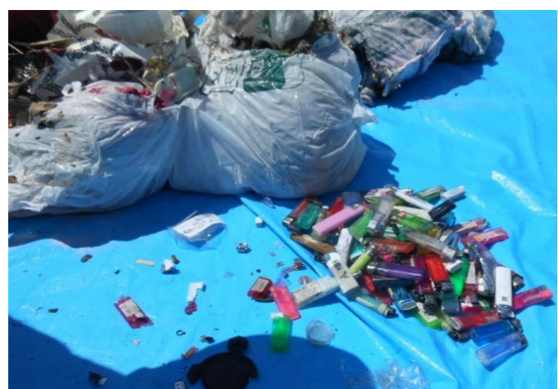
家庭ごみ指定袋に入れられた大量のライターが発火した事例

家庭ごみ指定袋やプラスチック製容器包装指定袋の中に混ざったライターを原因とする収集車の火災が発生しています。