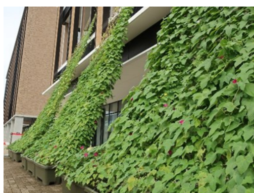
たまきさんサロンでの設置例

町内会等の団体や施設、ご自宅などで緑のカーテン設置に取り組んでみたい方に種子を無料配布します。ご希望の方は、はがきまたはFAXに、団体（施設）名または氏名、送付先、電話番号、下記①～③の希望数を記入し、お申込みください。（なくなり次第終了します） ①ゴーヤ（1袋5粒入り） ②西洋朝顔（1袋10粒入り） ③風船かずら（1袋10粒入り） (問) 環境共生課 214-0007