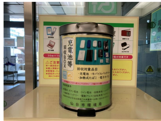
充電電池等回収ボックス