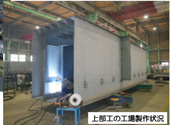
上部工の工場製作状況