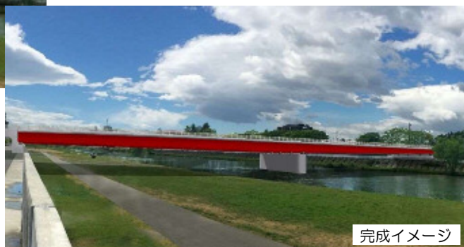
図-2 今回報告（令和5年）