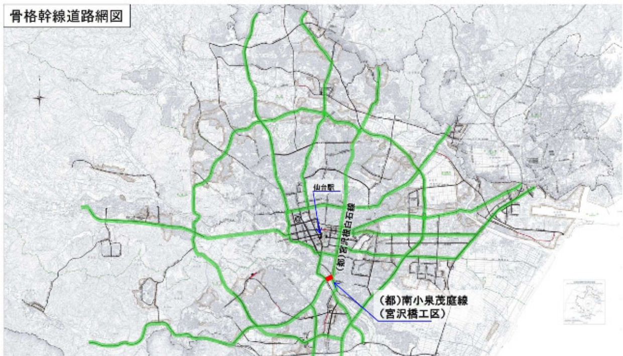
骨格幹線道路網図

公共交通を中心とした交通体系や災害時も含めた、人流・物流などの都市活動を支える道路ネットワークの一環として、整備を進めます。