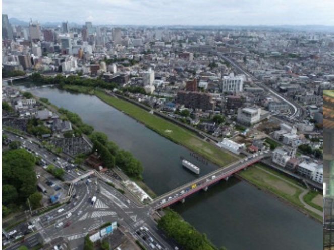
宮沢橋工区の状況 (令和5年6月時点)