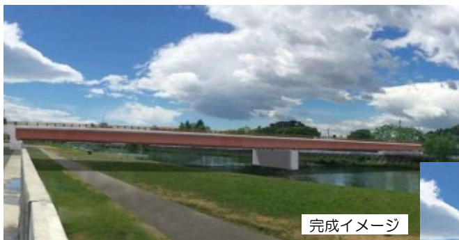
図-1 前回報告（平成30年）