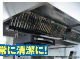
厨房設備は常に清潔に!

清掃、必要な点検及び整備など厨房設備の維持管理は「火災予防条例」で義務づけられています。