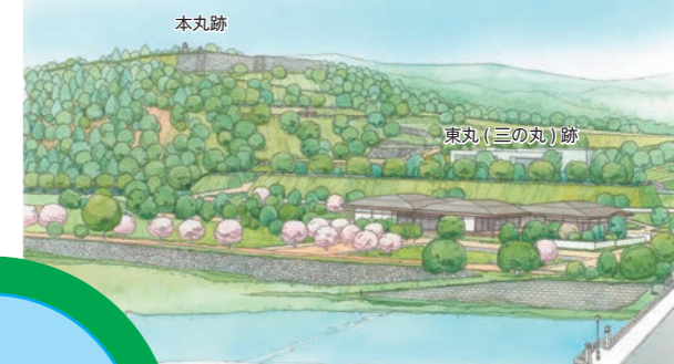
整備イメージ図(広瀬川対岸から)