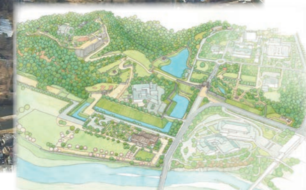
整備全体のイメージ図(本質的価値が顕在化された姿) ※現時点での整備イメージ図であり、今後整備内容を変更する場合があります。