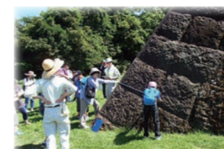
親子石垣見学会の様子

ホームページや刊行物の発行などを通じて、仙台北城跡の価値や調査成果を積極的に発信するとともに、石垣清掃イベントの実施など市民協働事業をより一層進めます。