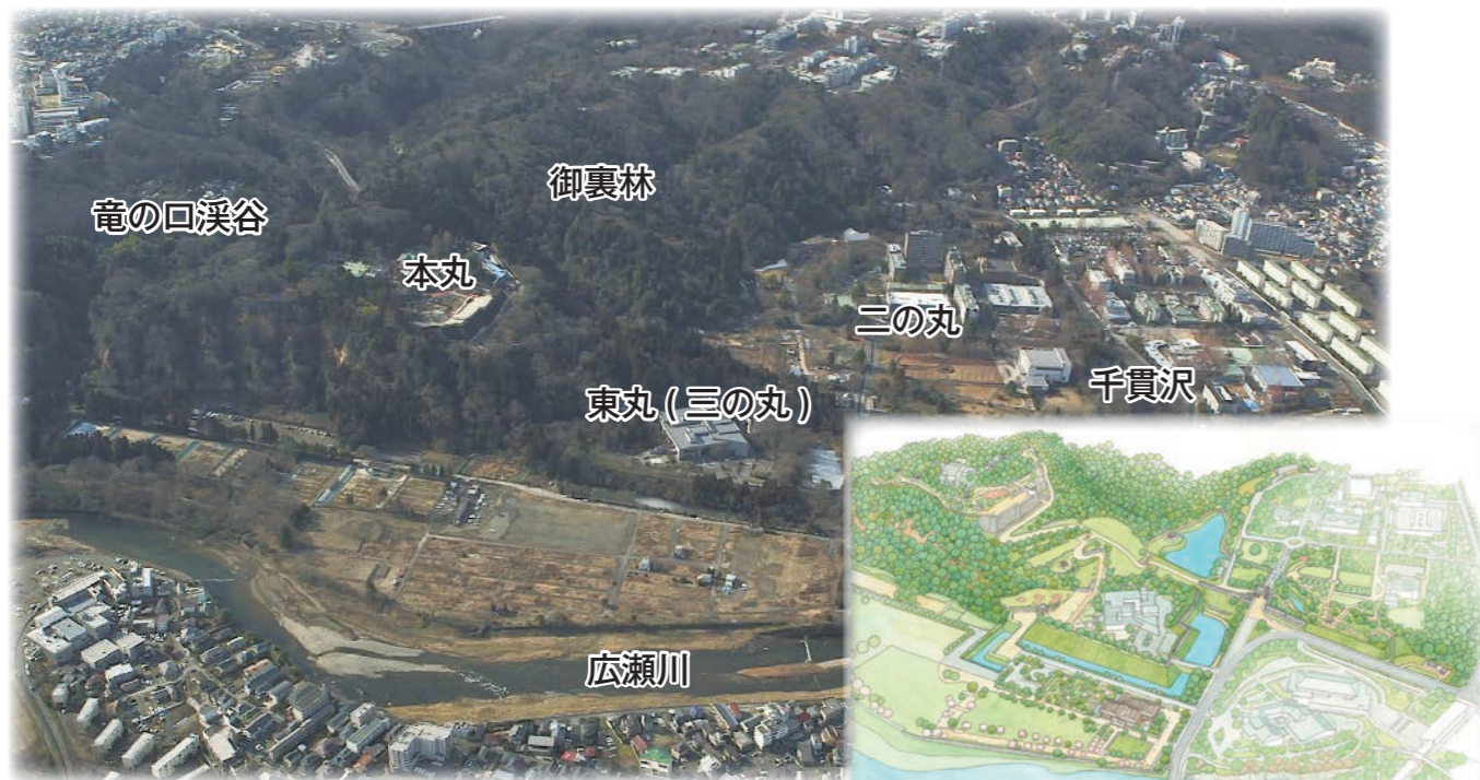
仙台城跡航空写真(2016年撮影)

青葉山に抱かれた仙台城跡は、「仙台」発祥の地として、地域と共に歴史を刻んできました。本丸跡からの眺望は来訪者に緑豊かな景観を印象付け、「杜の都」の呼称の普及に大きく貢献しました。