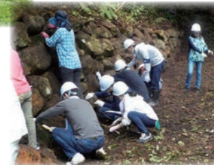
石垣清掃イベントの様子