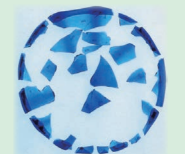
出土遺物(ヨーロッパ産硝子器)

伊達政宗は、伝統を重んじつつ新しい要素を組み入れることにより特色のある文化を築きました。これまでの発掘調査でも大広間を含めた御殿群や、ヨーロッパ産硝子器や金箔瓦など政宗らしさをうかがわせる特徴的な遺構・遺物を確認しています。