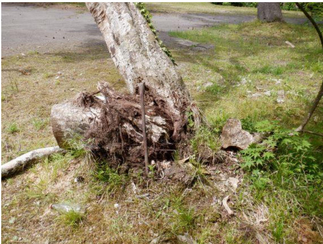
写真5 令和5年5月（根際状況）