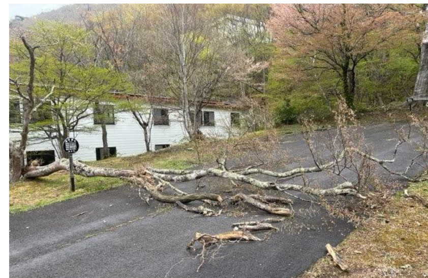
写真3 令和5年4月（倒伏状況）