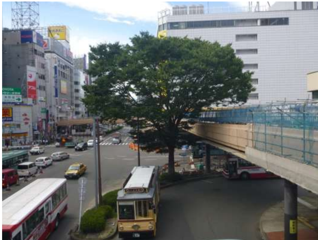
写真① :ホテルメトロポリタン側から撮影