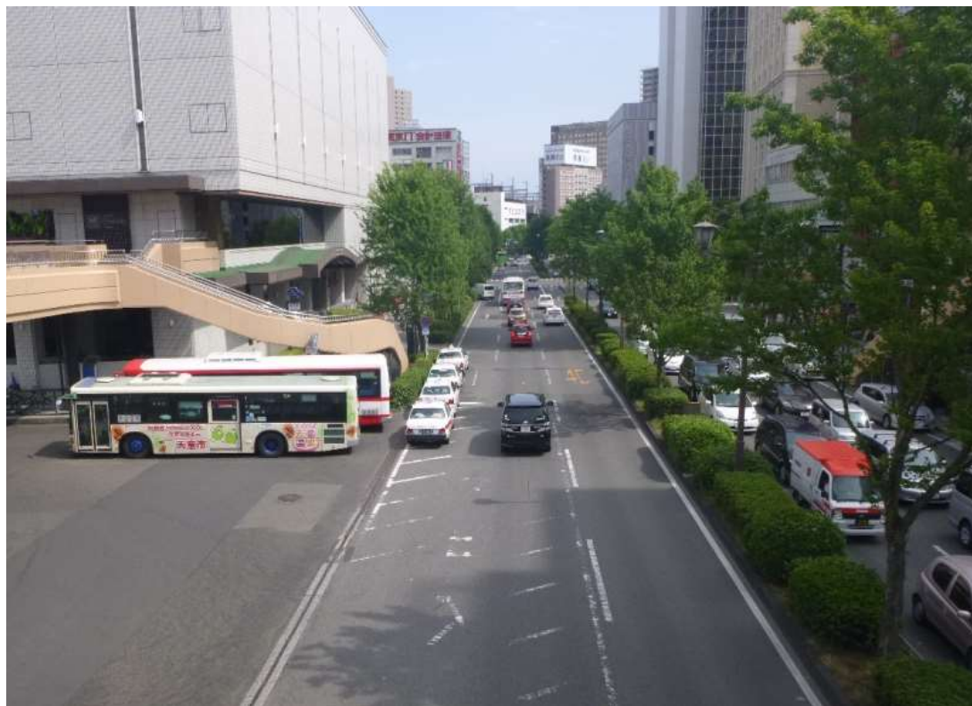
写真②:愛宕上杉通の植栽状況