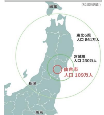
東北地方から集まる優秀な人材

また、仙台・宮城へのUターン希望者のみならず、地元は仙台・宮城ではないが、地元への近さと都市規模で仙台を選ぶJターン希望者も多く、仙台市では移住や就職の支援も手厚く行っていますので、首都圏でキャリアを積んだ優秀な人材を確保することも可能です。