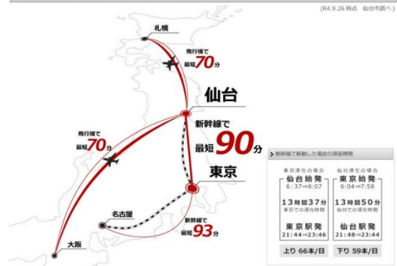
東京や国内主要都市との良好なアクセス

東北新幹線は、仙台-東京間を最短90分で結び、日帰りビジネスも快適な環境にあります。本社との密な連携やトラブル発生時の迅速な初動対応が可能です。