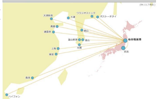
仙台港からの直接航路

仙台塩釜港は、世界100か国・300港以上の国々と貿易が行われている、東北唯一の国際拠点港湾です。定期航路は中国、韓国、ロシア及びベトナムを結ぶ外貿コンテナ定期航路に加え、東京、横浜港を結ぶ内航フィーダー航路も充実しています。