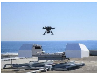
津波広報ドローン

若者が多いコンパクトな市街地ばかりではなく、山地や農地、海にも近く、多様な実証フィールドを備えています。国家戦略特区にも指定され、AI、IOT、自動走行やドローン等の実証実験を促進するため、必要な手続きに関する支援等を一括して行う相談窓口を設け、民間企業等による実証実験の円滑な実施をサポートしています。