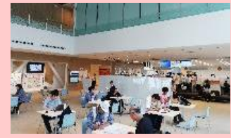
庁舎利活用・フレキシビリティ (大宮区役所)