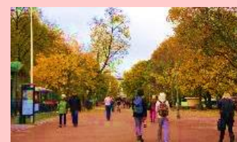
回遊性のある 空間形成