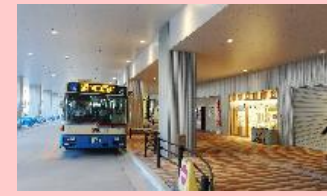
交通環境の改善 (神戸市北区役所)