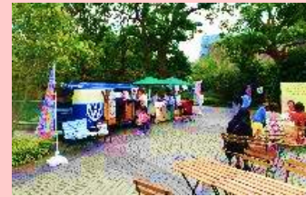
← イベント時の広場の活用