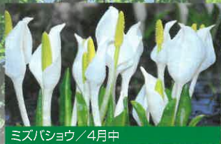
ミズバショウ / 4月中