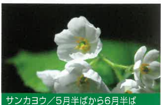
サンカヨウ / 5月半ばから6月半ば