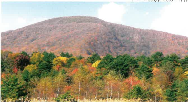
岡沼より山頂を望む

登山口まで県道223号泉ヶ岳公園線を行き、薬師水を過ぎると、胎内くぐりの岩場です。そこから山頂までは、林のなかをひたすら登る最も険しいコースです。