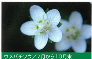
ウメバチソウ / 7月から10月末