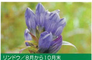
リンドウ / 8月から10月末