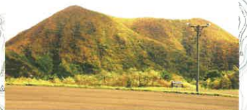
スプリングバレー駐車場からアララギ山を望む