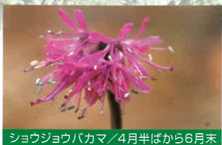
ショウジョウバカマ / 4月半ばから6月末