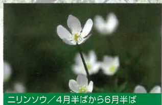
ニリンソウ / 4月半ばから6月半ば