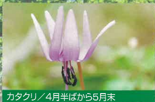
カタクリ / 4月半ばから5月末