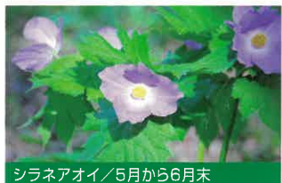
シラネアオイ / 5月から6月末