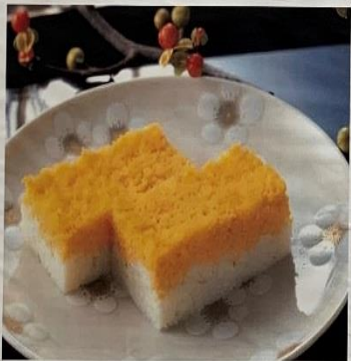
錦卵(にしきたまご)