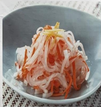
紅白なます(こうはくなます)