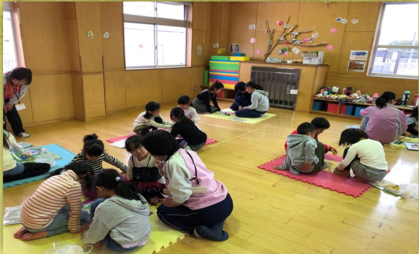
すごろく・福笑い