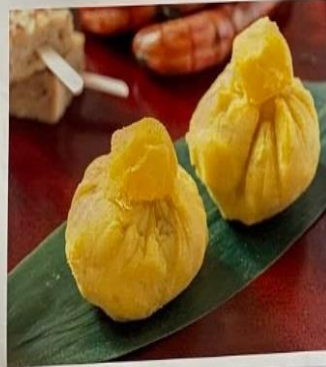
栗きんとん(くりきんとん)