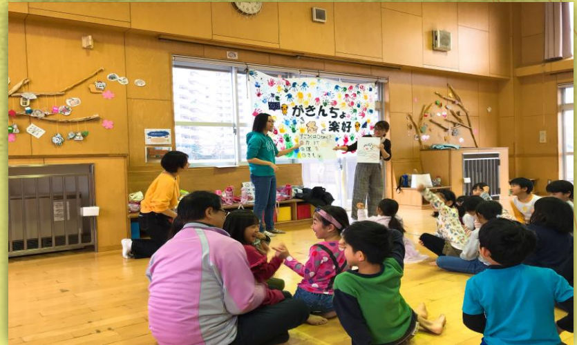
お正月遊びクイズ