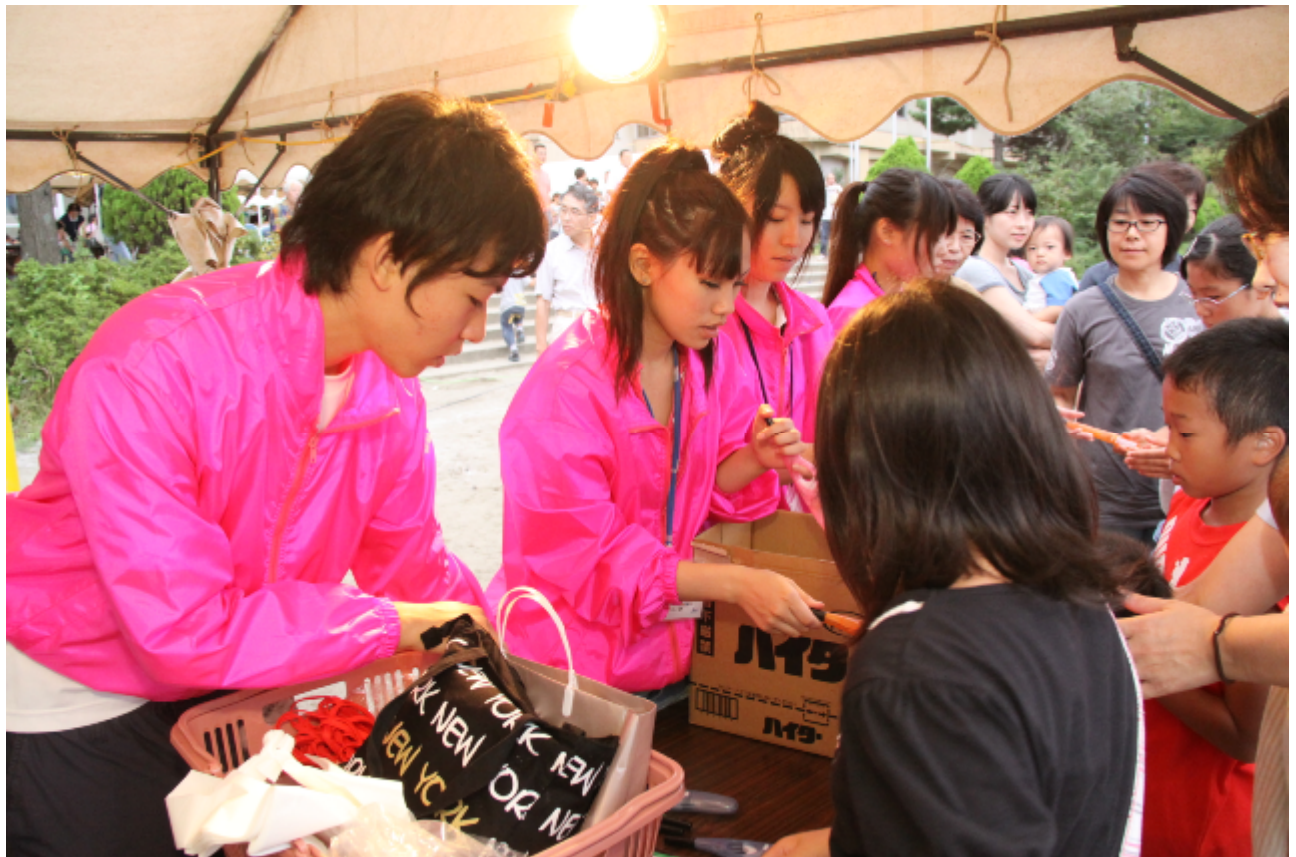
地域の夏祭りでは、ボランティアでお手伝い