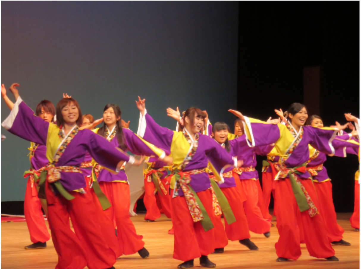
泉区民文化祭のオープニングで演舞披露