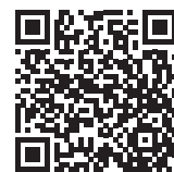
仙台市情報モラル教育推進事業

★総務省のサイト https://www.soumu.go.jp/use_the_internet_wisely/trouble/