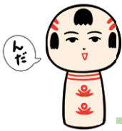
仙台弁こけし いぎなしなまってる 宮城のご当地キャラクター

日々の生活を振り返りながら、これから続けていきたいことや新たに組みこんでみたいことなど、どのように過ごしていきたいか考えてみましょう。