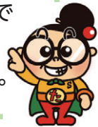
オタッシャー 仙台市介護予防・認知症対策 イメージキャラクター

この手帳は、日々の生活と活動の様子を自分で記録するために使います。 活動に参加する時は、持ち歩くようにしましょう。