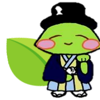
生出地域キャラクター おいでもん