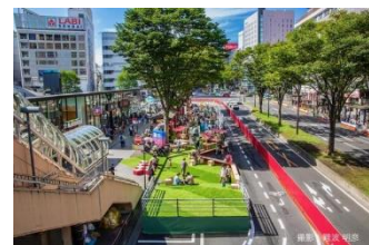
青葉通駅前エリアにおける社会実験