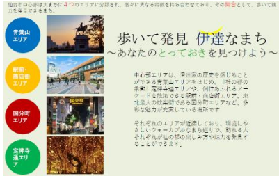
中心部エリアブランドコンセプト