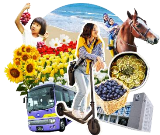
暮らしに+ (プラス) せんだい海手 リゾート宣言