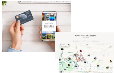
仙台MaaS及びポータルサイト

「せんだい旅日和」などのアクセス解析や、携帯電話の位置情報による動態データの分析。仙台MaaSポータルサイトに様々な観光スポットやイベントがわかるデジタルマップを掲載、観光客の顧客管理システムの実証事業など