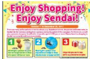
外国人観光客消費拡大キャンペーン

対応力向上セミナー、ムスリム等対応店舗の拡充や土産品の開発、市内宿泊者向けクーポン券配布キャンペーンなど