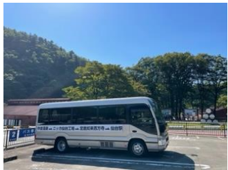
作並・定義リトリートバス