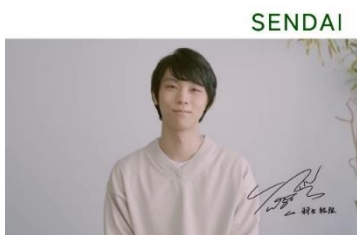
観光アンバサダー