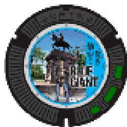
デザインマンホール