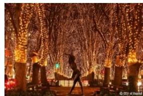
光のページェント