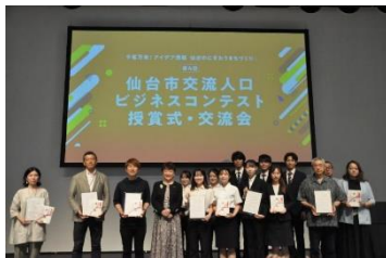
交流人口ビジネス表彰