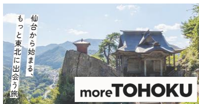
仙台を起点とした東北周遊の促進