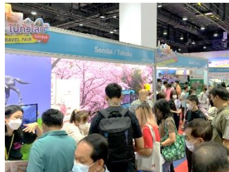
現地旅行博への出展