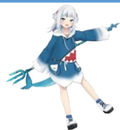
インフルエンサーの活用／首都圏からの誘客