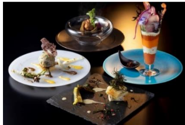
食の多様性への対応