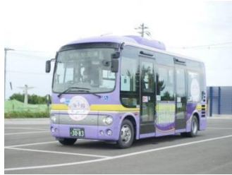
海手線ループバス