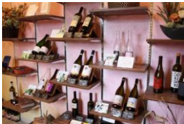
中小企業チャレンジ補助