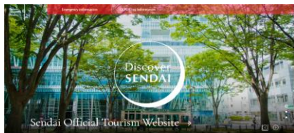
多言語WEBサイト／SNSを活用