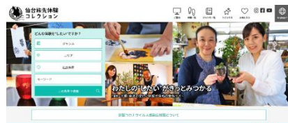
1000本の体験プログラム／認知拡大イベント