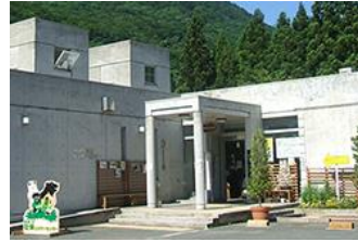
秋保ビジターセンター リニューアル