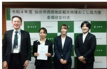
地域おこし協力隊