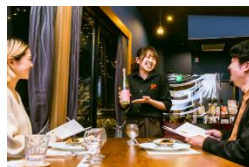
東北各地と連携した共通テーマでの着地型旅行商品等の造成

東北絆まつりによる知名度向上、東北を車で周遊するロードトリップ、各地の地域DMO等と連携など