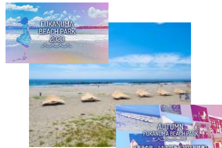
深沼ビーチパーク