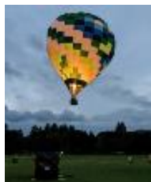
ナイトコンテンツ