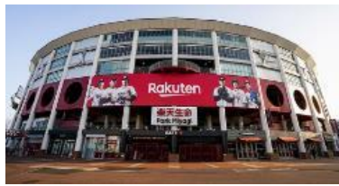
ユニークベニュー・視察メニュー