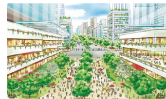
仙台駅前の将来イメージ