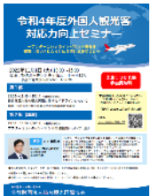
受入対応力向上セミナー