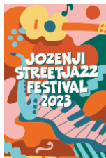
定禅寺通ストリート ジャズフェスティバル