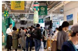
首都圏プロモーション