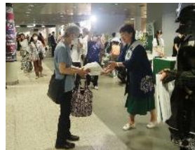
就航地プロモーション