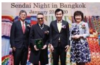
タイ・台湾トップセールス／タイ国際航空との意見交換