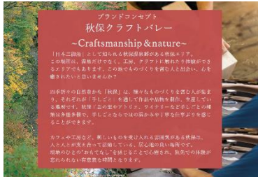
西部エリアブランドコンセプト