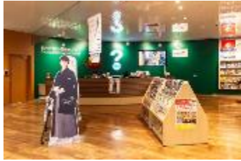
観光情報センター機能強化