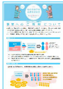
仙台市奨学金返還支援事業

交流人口ビジネスの優良事例やビジネスプランのアイデアを表彰、地域おこし協力隊の活用、奨学金返還支援など