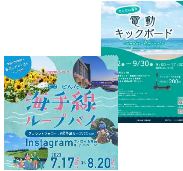
東部交通実証実験