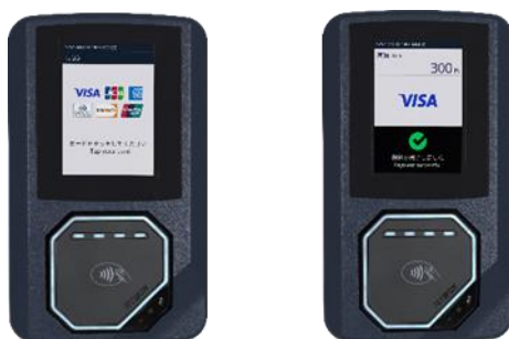
<専用リーダー（イメージ）>

お手持ちのタッチ決済対応のカード（クレジットカード・デビット・プリペイド）や、カードが設定されたスマートフォン等を、専用リーダーにタッチすることで、そのまま乗車（降車）いただけます。