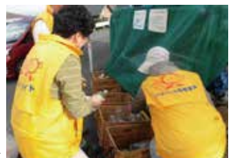
クリーン仙台推進員の活動の様子▶

令和4年4月1日現在で、2,418名のクリーン仙台推進員と、1,533名のクリーンメイトの方々がボランティアで活動をしています。