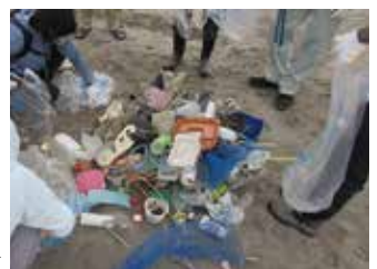
海岸漂着物実態調査の様子▶

海洋プラスチックごみについて、本市の現状を把握するとともに、市民へ周知啓発を行うため、令和2年度より若林区荒浜において海岸漂着物の調査を実施しています。また、令和3年度は、河川を通じた流出状況を把握するため、河川の漂着物調査も実施しました。