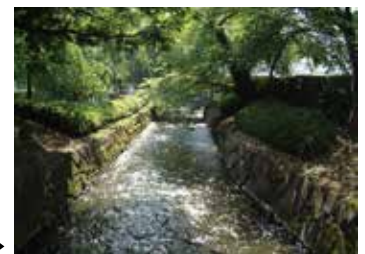
非かんがい期に通水された七郷堀▶

令和3年度については、事業期間（令和3年9月11日～令和4年4月24日）において、対象となる8水路に129日の通水を実施しました。