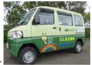
公用車への電気自動車導入例▶

令和3年度末現在における次世代自動車の保有台数は、ハイブリッド自動車103台、天然ガス自動車30台、クリーンディーゼル車13台、電気自動車53台、プラグハイブリッド自動車13台、低燃費・低公害車734台の計946台に達しています。