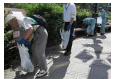
▶仙台中央地区「ポイ捨て」防止キャンペーン（令和元年度の様子）

また、市民のまち美化活動への参加を促進するため、全市一斉「ポイ捨てごみ」調査・清掃キャンペーン（アレマキャンペーン）を実施しています。