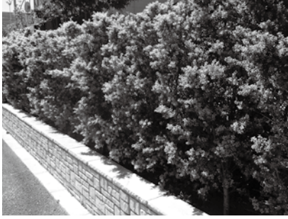
▲生垣づくり助成事業