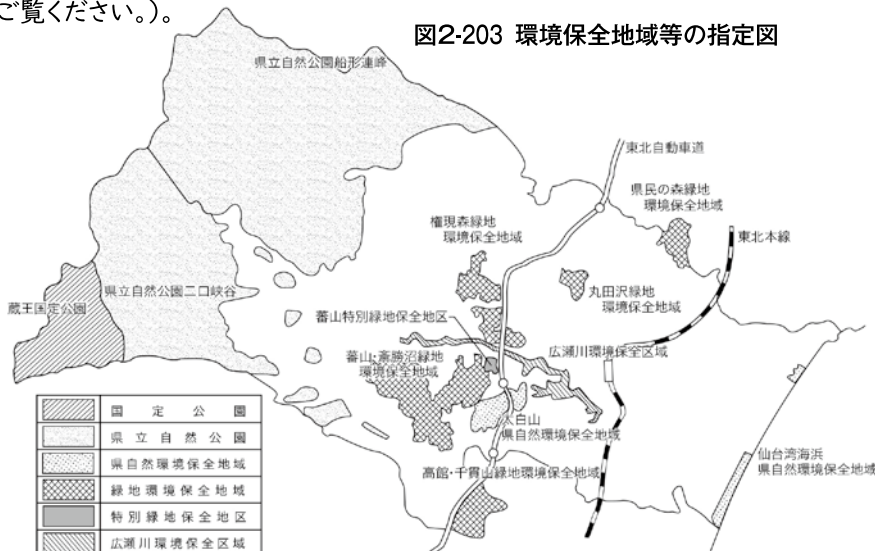
図2-203 環境保全地域等の指定図

※このほかに、「杜の都の環境をつくる条例」に基づく、40カ所の保存緑地があります。 ※特別緑地保全地区は4カ所ありますが、図中には「蕃山特別緑地保全地区」のみ表示。