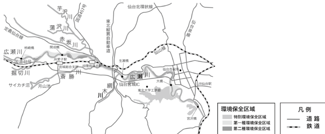
図2-204 環境保全区域図

また、環境保全区域内の建築物設置者に対しては、自然環境の回復と調和ある景観づくりのために緑化木の交付や緑化助成を行っています。令和3年度の交付は4件、助成は2件でした。