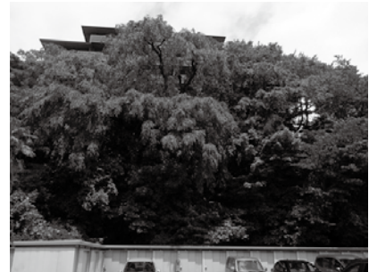
▲保存樹林 (青葉区八幡の屋敷林(令和3年11月指定))

本市の青葉山や広瀬川、社寺林や屋敷林、市民の力で守り育ててきた市街地を囲むみどり、そして街路樹といった誇るべきみどりのより一層の整備や保全、活用に取り組みます。