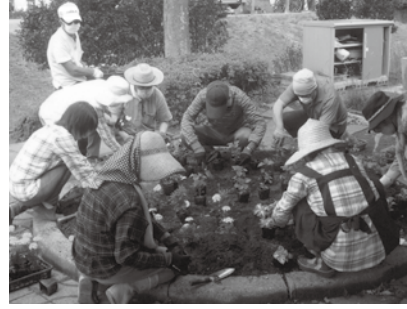
▲花壇づくり助成事業