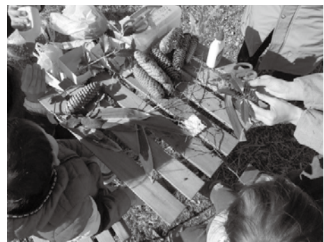
▲ヒロセガワプレーパーク