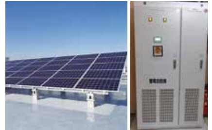
▲指定避難所の太陽光発電パネルとリチウムイオン蓄電池

さらに、2050年ゼロカーボンシティの実現に向けて、脱炭素型の建築物の普及を進めることが重要であることから、建替が予定される市役所や泉区役所の新庁舎などにおいて、ZEB化に取り組んでいるほか、施設の大規模改修時にもZEB化を目指し、学校や市民センター等の複数のモデル施設を対象とした実証に取り組んでいます。