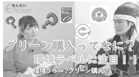
▲グリーン購入啓発動画

令和5年度は、市立小学校の新入学児童保護者にグリーン購入啓発チラシを配付しました。また、伊達武将隊が出演するグリーン購入啓発動画を、「せんだいTube」及び「せんだい環境Webサイトたまきさん」で配信しています。