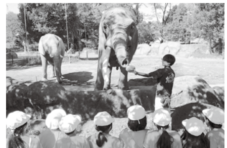
▲ゾウ糞堆肥で栽培したカボチャをゾウに与える様子