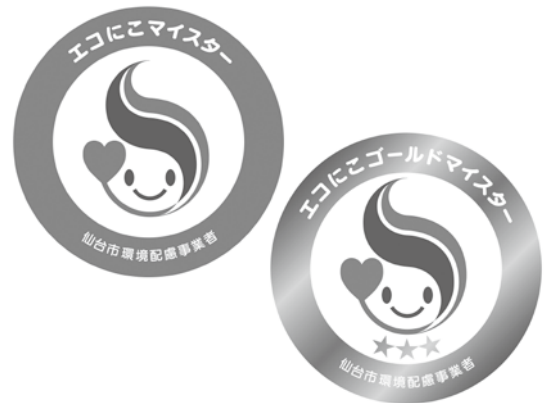
▲「エコにこマイスター」「エコにこゴールドマイスター」の認定マーク

令和6年3月現在の認定事業所の数は146、認定店舗・事業所等の数は505となっています。